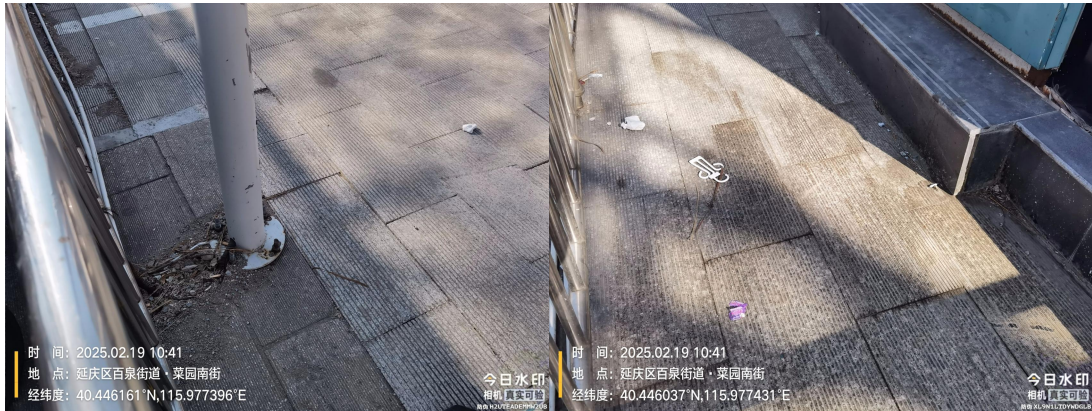
大东昌超市门前(良好)T11:13