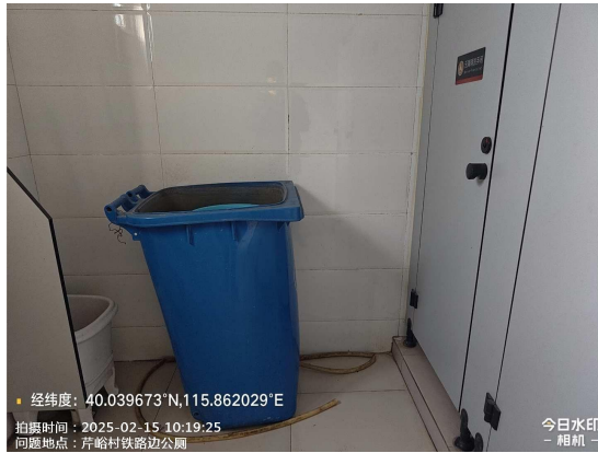
苇子水村桥头公厕(地面瓷砖破损)T09:46