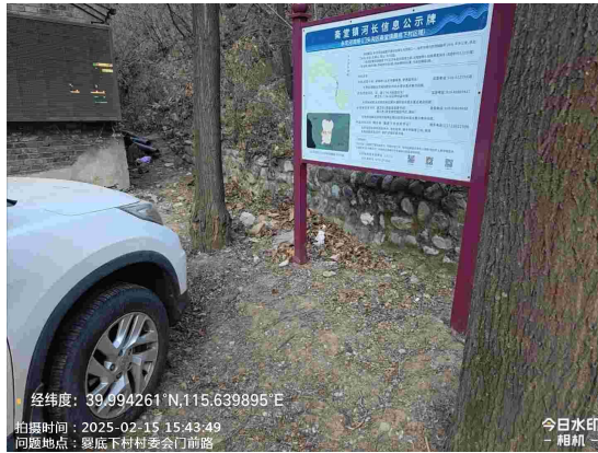
双石头村村委会门前路(良好)T15:37