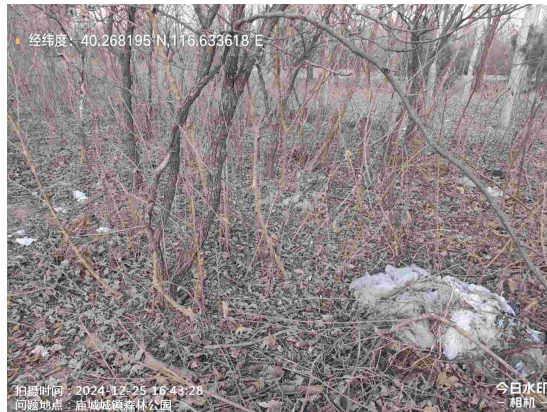
庙城镇森林公园绿地(绿地内有废弃物)T16:43