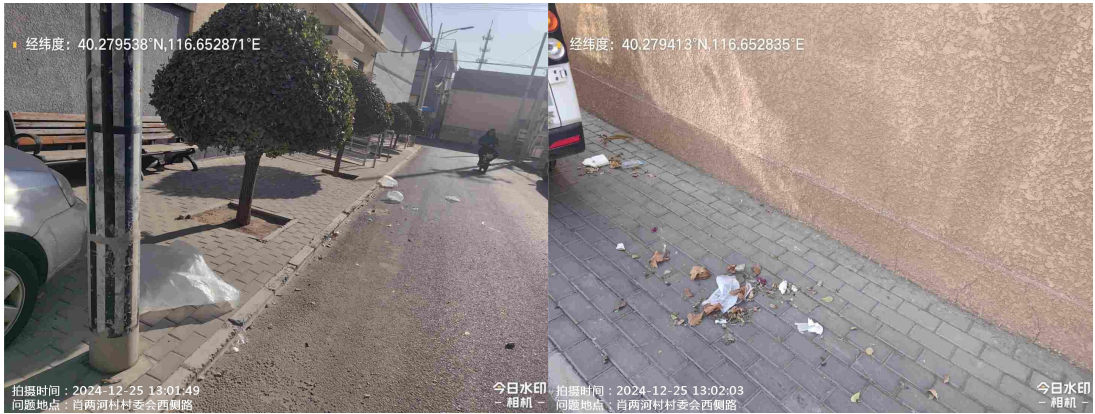
高两河村村委会门前路(良好)T13:07