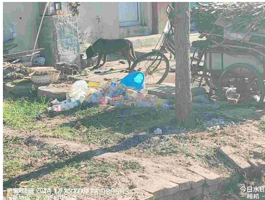
小官庄村委会门前路(路面堆物堆料)T11:05