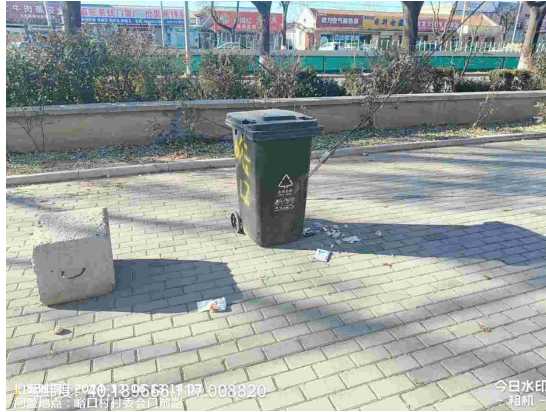
西营村委会门前路(良好)T12:09