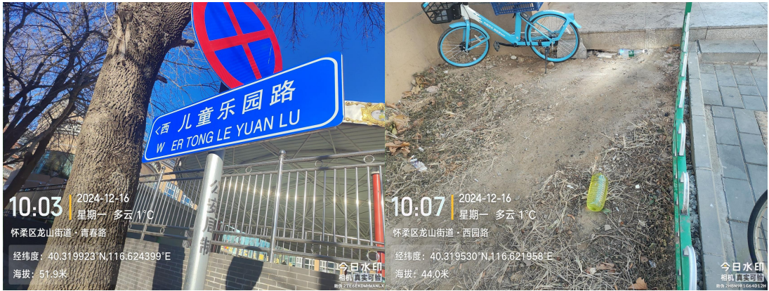
儿童乐园北街(良好)T10:00