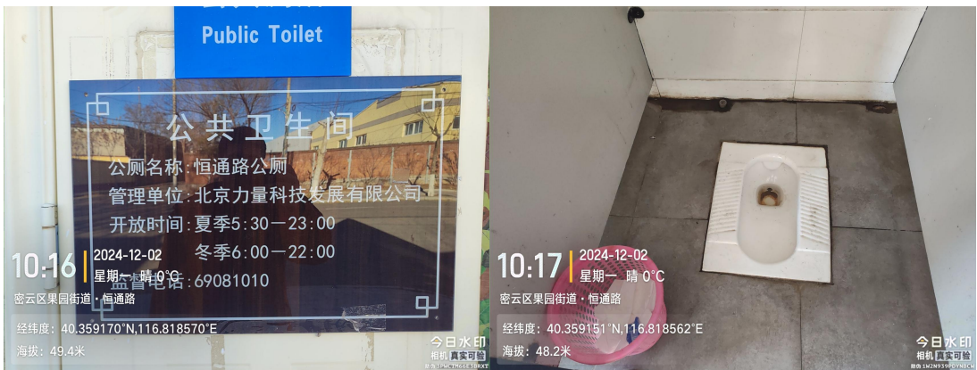
恒通路公厕(蹲台不洁)T10:16