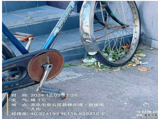
新南路（北侧家和家乐饴恪）（良好）T10:28