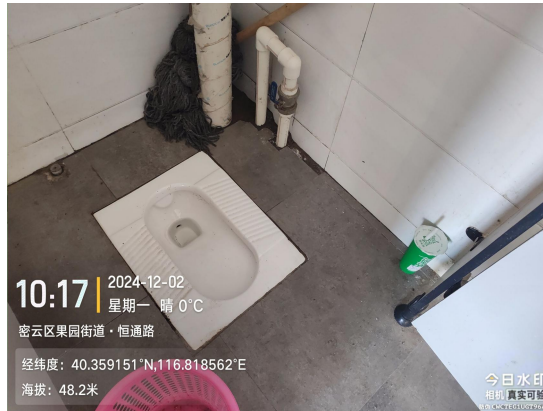
恒通路公厕(便器内有污渍)T10:16