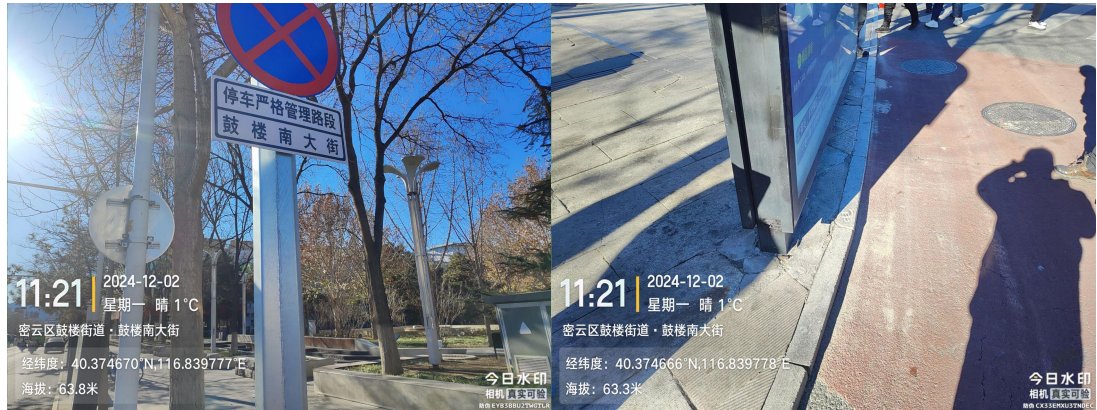
鼓楼南大街(道路边线有浮土)T11:21