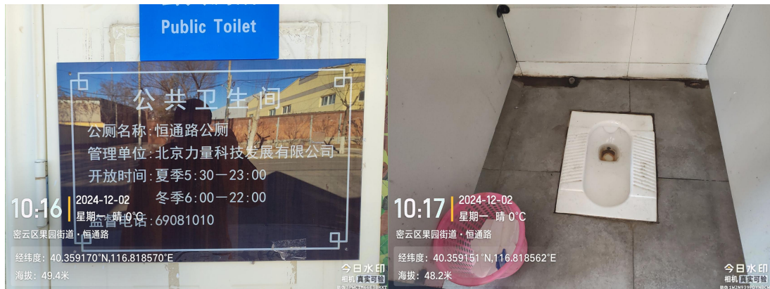
恒通路公厕(保洁员不在岗)T10:16