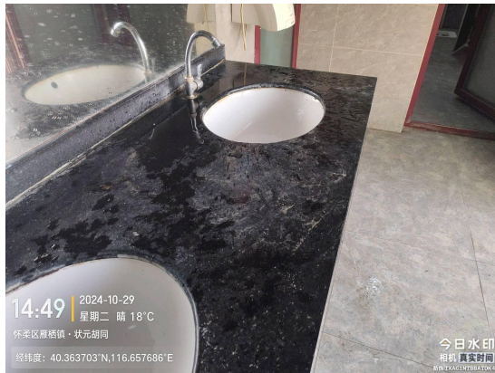
范各庄村老粮库南公厕 No. 27(良好)T14:53