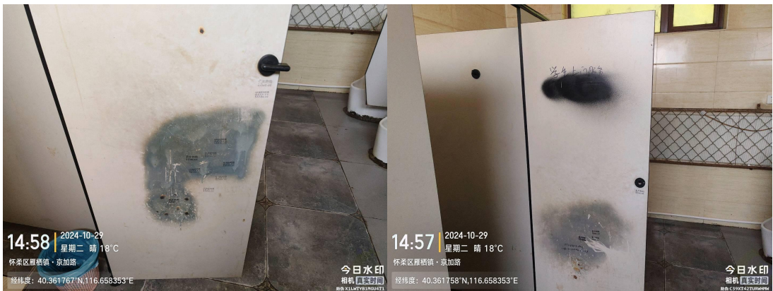
范各庄村小懒羊公厕 No. 28(厕位门脏污)T14:57