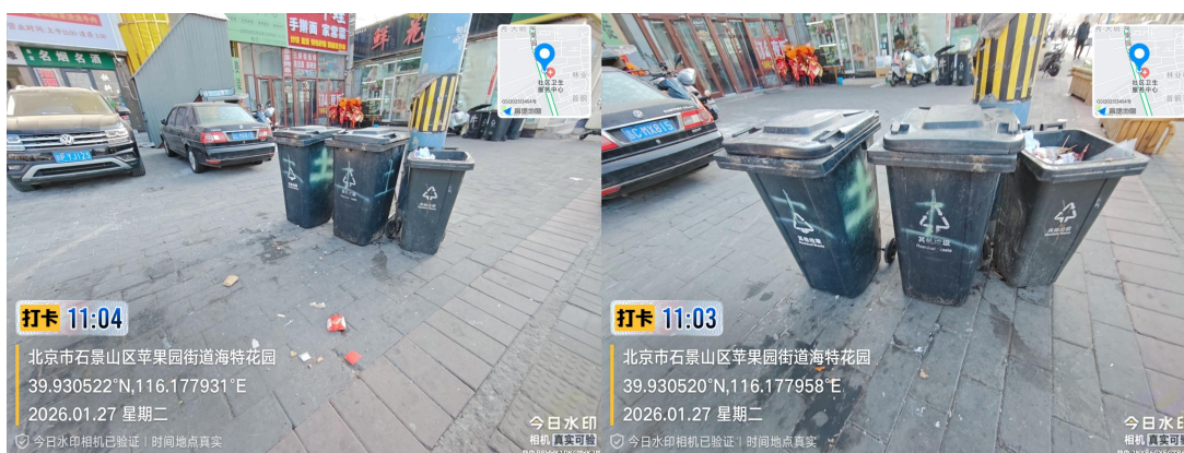
苹果园大街(地面不洁)T11:04