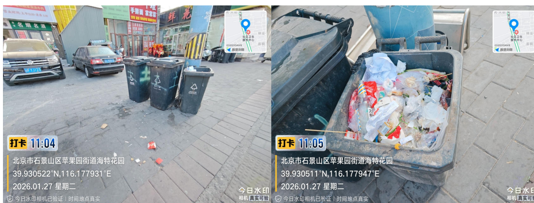
苹果园大街(垃圾桶脏污)T11:04