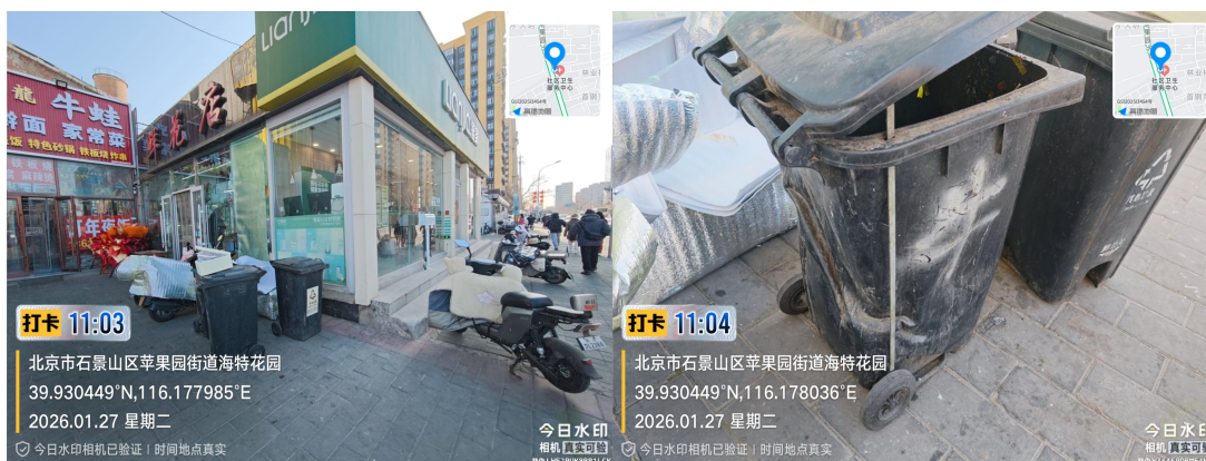
苹果园大街(垃圾桶破损)T11:04