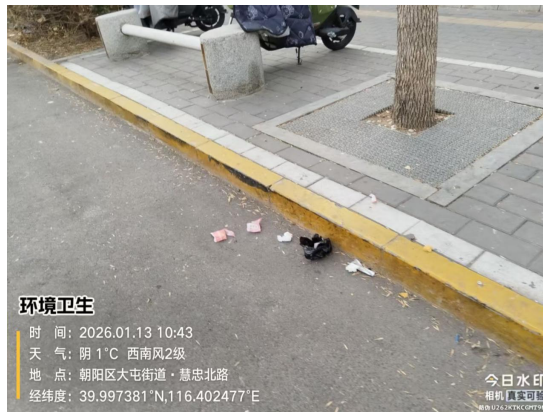
慧忠路(路边线有废弃物)T10:54