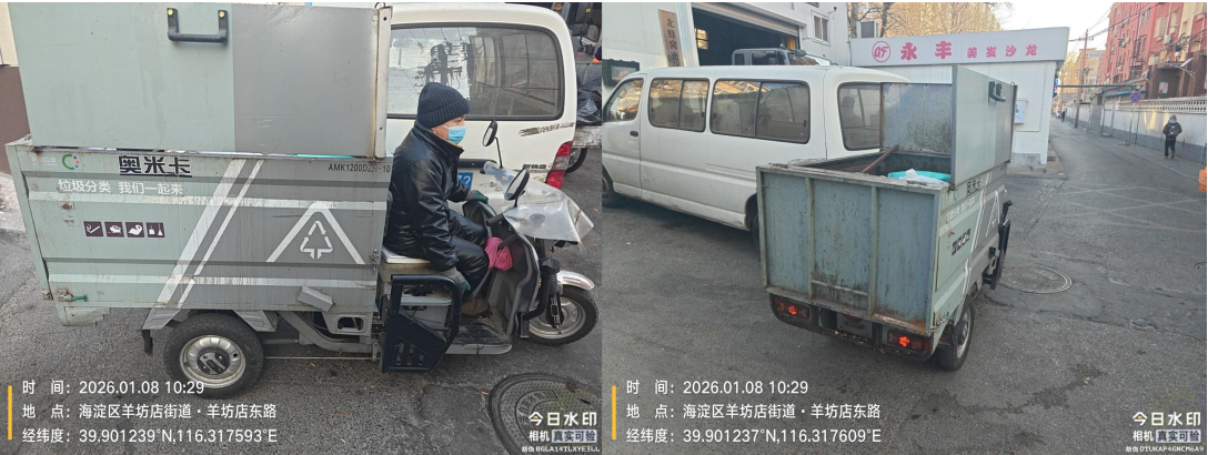
羊坊店东路(驾驶员未佩戴头盔)T10:29