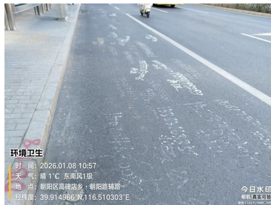
朝阳路辅路(果皮箱未套袋)T10:57