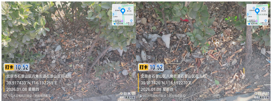
杨庄东街(门前责任区有废弃物)T10:53