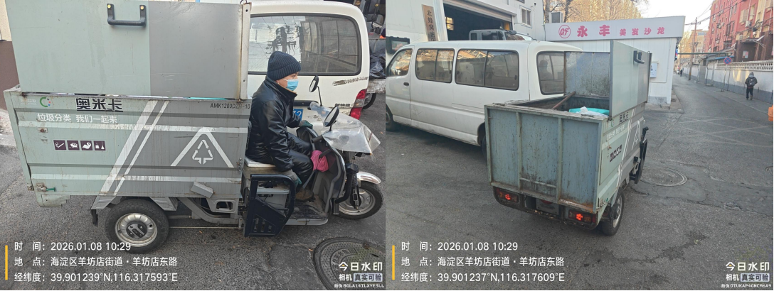
羊坊店东路(无号牌上路作业)T10:29