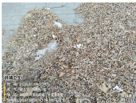
英家坟密闭式清洁站对面区域(其他责任区内堆放暴露垃圾)T10:21