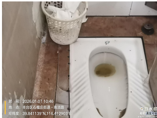
石村北 205 号公厕(责任区不洁)T10:51