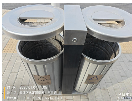
金沟河路(果皮箱未套袋)T11:09