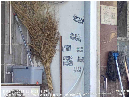
西直河村村委会门前路(有非法宣传品张贴)T13:33