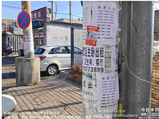
横街子村村委会门前路(良好)T13:33