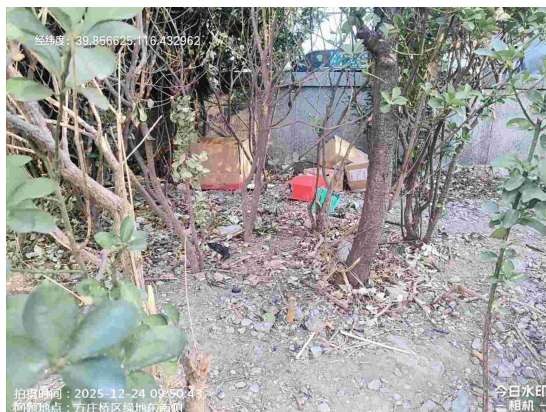
方庄桥绿地(绿地内有废弃物)T09:50