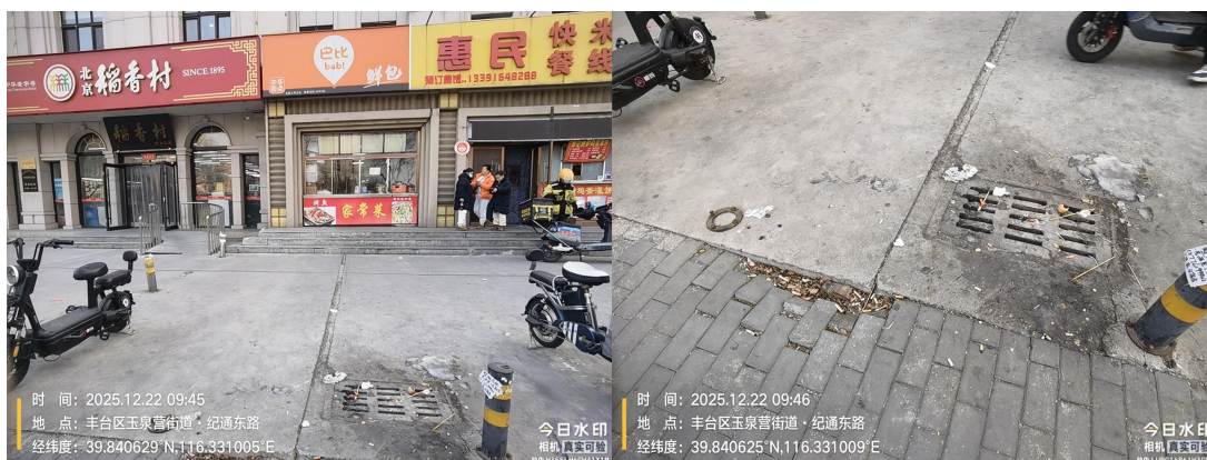
老俩口驴肉门前(良好)T10:07