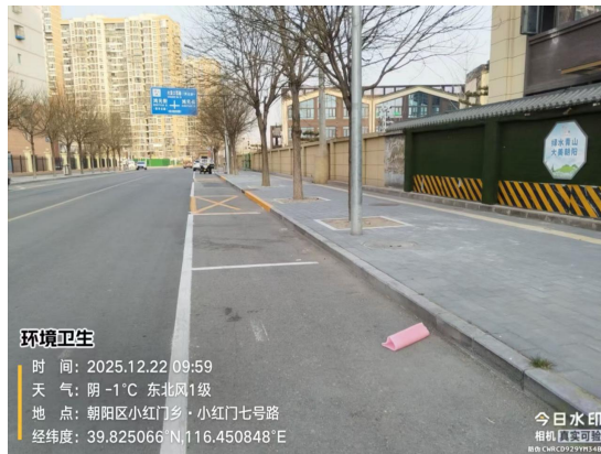
鸿博街(路边线和树坑内有废弃物)T10:01