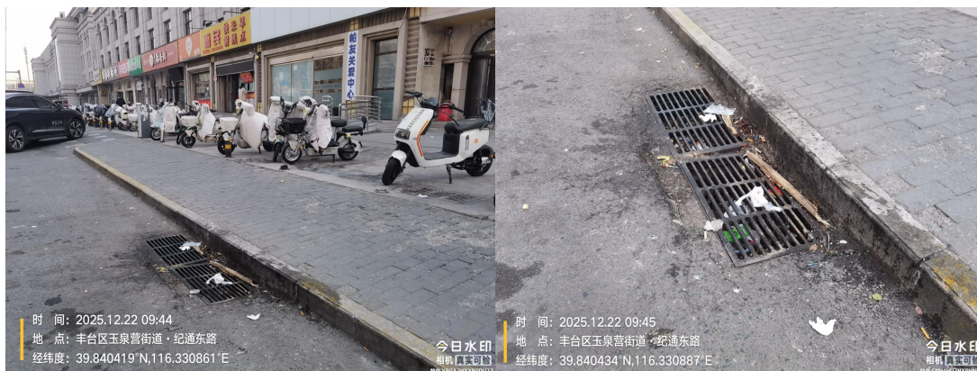
柳村路南段(道路边线有废弃物)T09:54