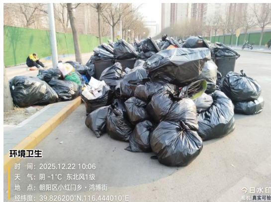
鸿博街路边桶站(周边不洁/地面有渗沥液)T10:06