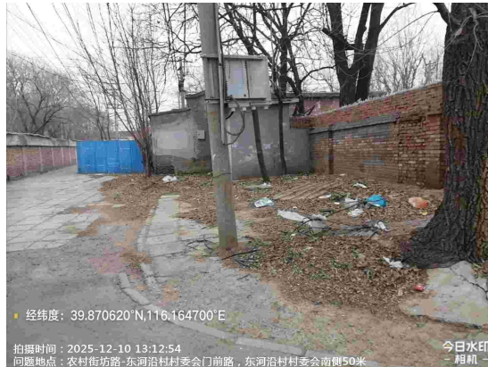
长辛店村村委会门前路(废物箱周边不洁)T15:16