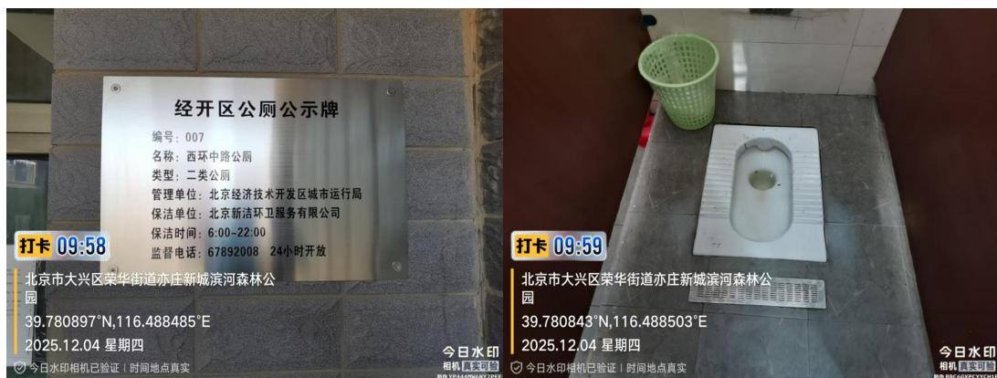
西环中路公厕(蹲台不洁)T09:58