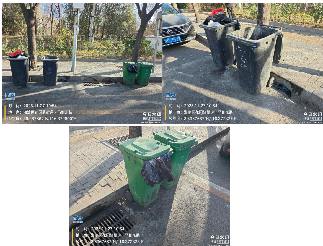
马甸东路南口路东垃圾收集站点(周边地面有污渍及废弃物)T10:54