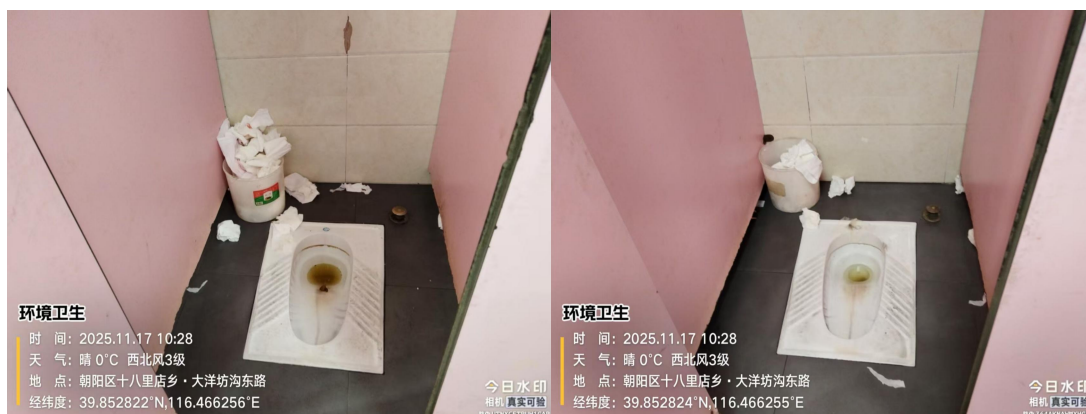
大洋路市场 6 号(蹲位不洁、便器内有积存物)T10:31