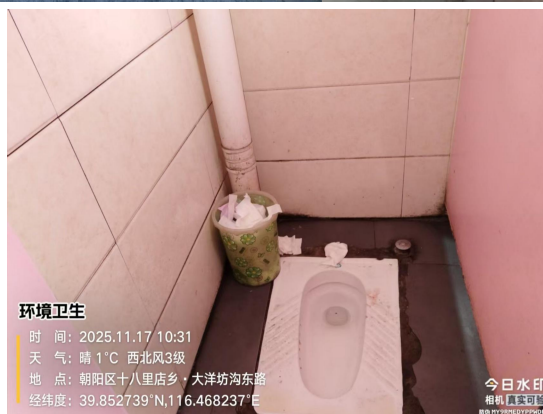
大洋路市场 6 号(墙面破损)T10:31