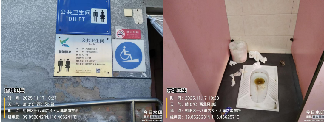
大洋路市场 5 号(蹲位不洁、便器内有积存物)T10:27