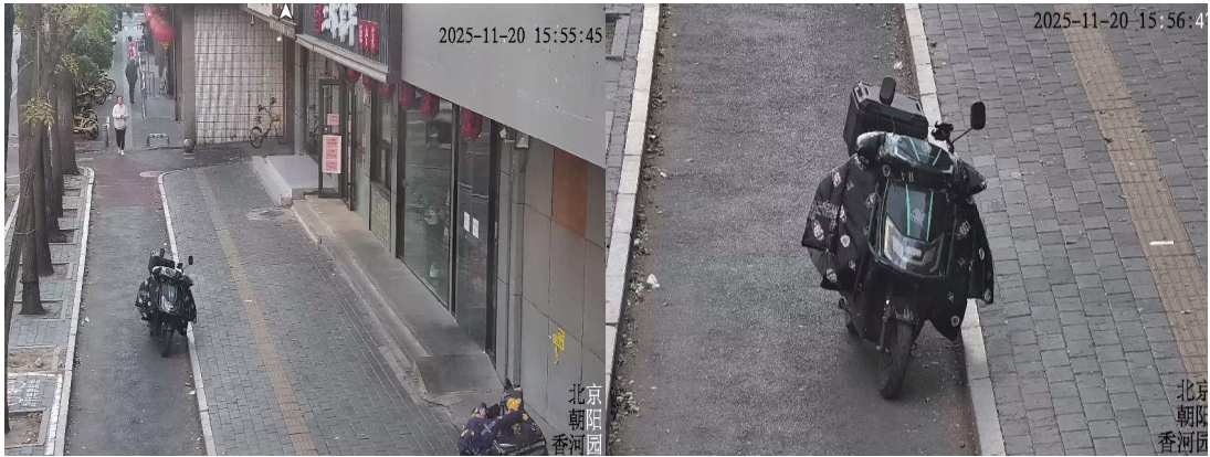
七圣南路(人行步道有废弃物)T15:58