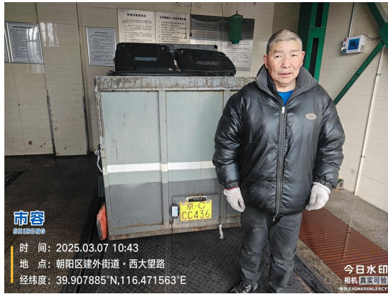
京 CCC436(驾驶员未佩戴头盔)T10:43