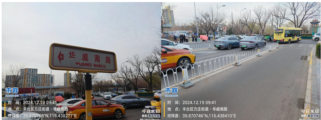
华威南路(非机动车隔离护栏下有浮土)T09:41