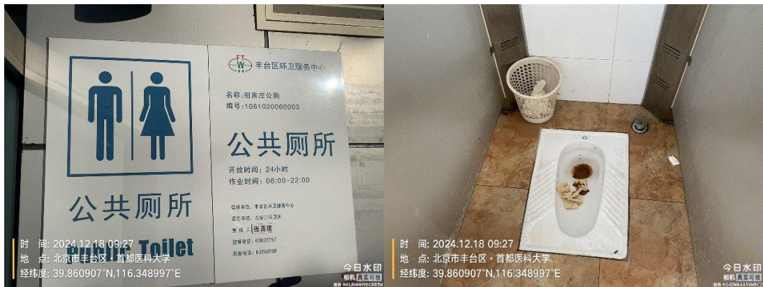
祖家庄(大便器内有积存物)T09:27