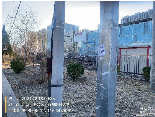
玉林东路(西侧绿地内有废弃物)T09:38