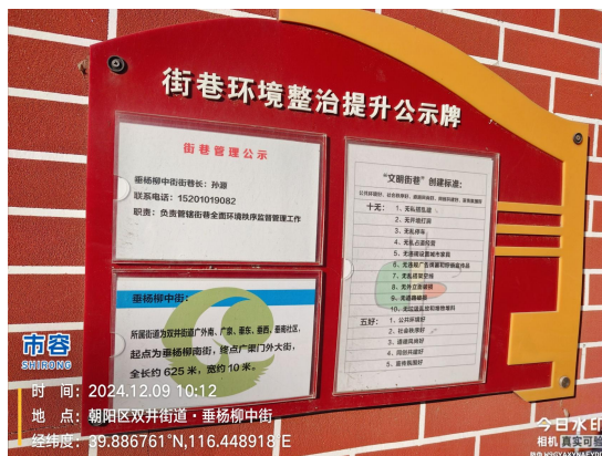
垂杨柳中街(西侧绿地内有废弃物)T10:12