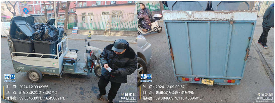
劲松中街(号牌损坏)T09:56