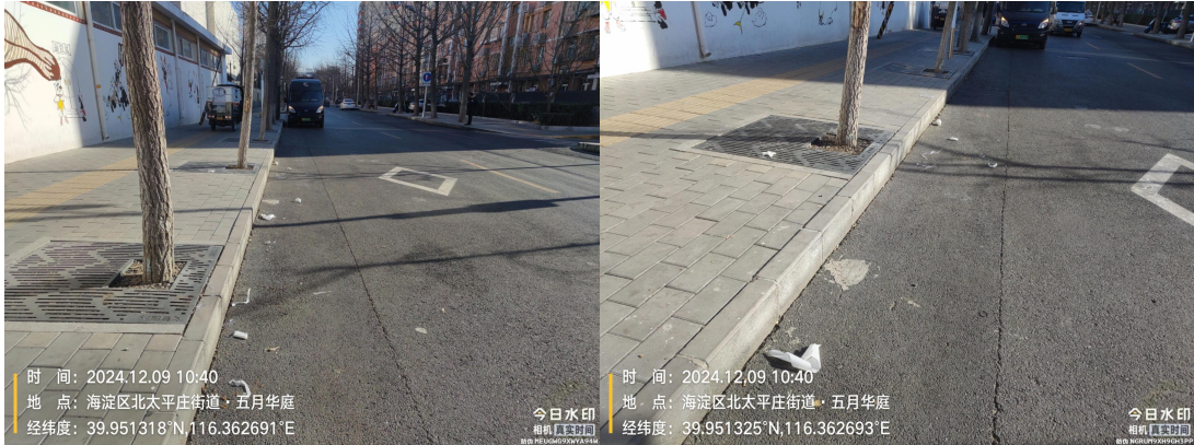
花园路(果皮箱满冒)T11:16