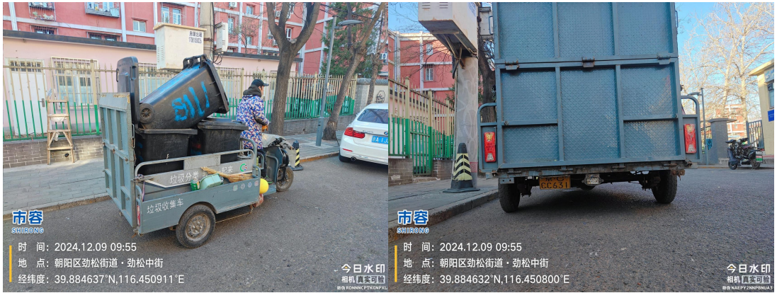
劲松中街(驾驶员未佩戴头盔)T09:56