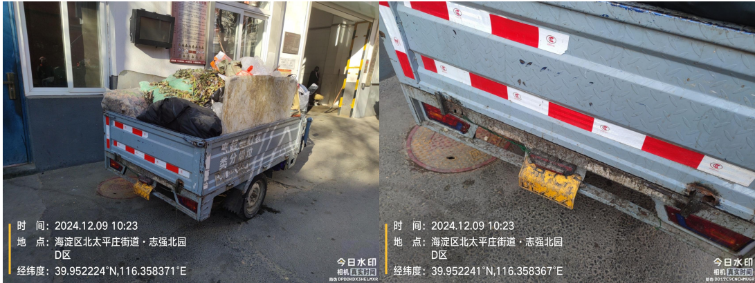
京 CD5126(未佩戴头盔、未携带驾驶证)T10:49