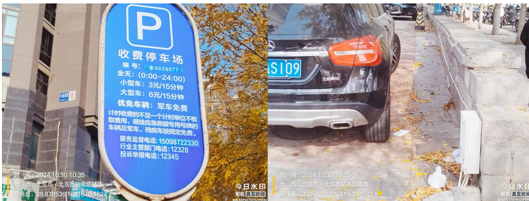
西站南路与茶马路交叉口停车场(责任区内不洁)T10:35