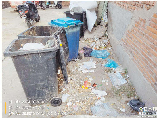
沙岗村垃圾房(保洁员不在岗)T09:09