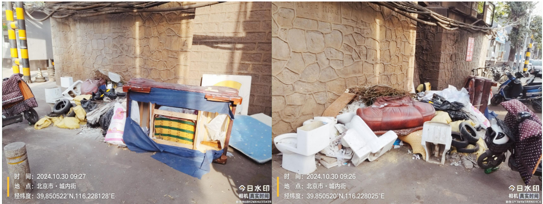
沙岗 10 号门前路(良好)T09:18