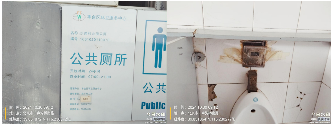
太平桥甲 99 号南院公厕(厕内小便器设施损坏)T09:12