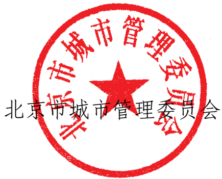
北京市城市管理委员会