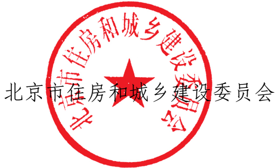
北京市住房和城乡建设委员会