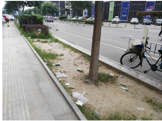
建新西街工业设计信息中心门前（绿地内有废弃物） T14:10