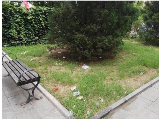
门头沟区：冯村中路绿地（良好） T8:29