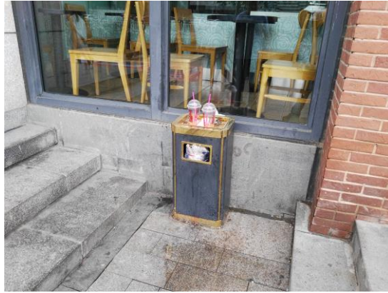
石门市场 5 号门门前（管理范围内有浮土和杂物）