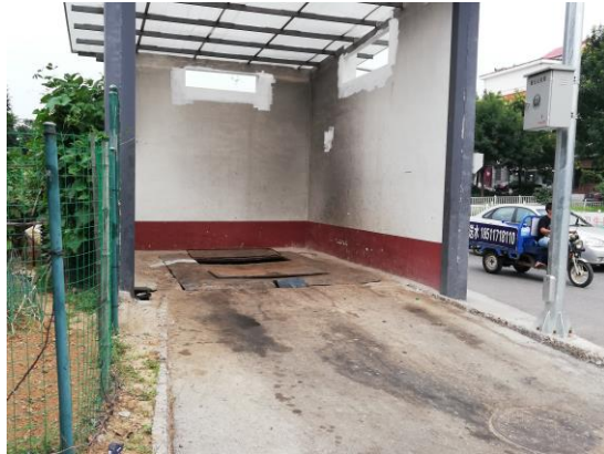
果园西里小区对面垃圾房（地面不洁） T14:56