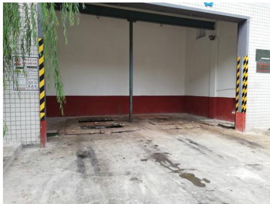
法制公园垃圾房（良好） T15:22