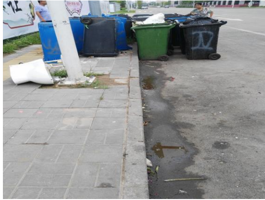
密云区：城关工商所东南角垃圾房（地面不洁） T12:25