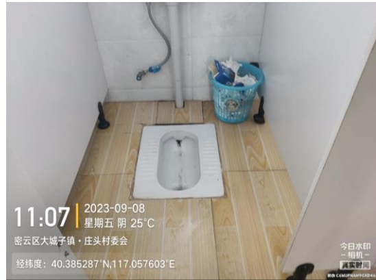
庄头新开峪公厕（纸篓满冒 T11:25）