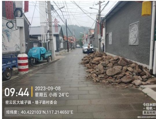
墙子路村中心路（墙子路村北口东侧 70 米处有建筑垃圾 T09:47）