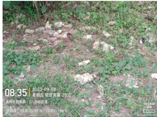
京哈高速进京方向<香河收费站-四方桥> (通州段: 31.1 公里处护坡有废弃物 T10:17/16 公里处路面有废弃物 T10:33)