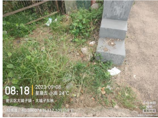
聂家峪村委会门前路（村委会门前 10 米处路面有碎石、废弃物 T08:24）