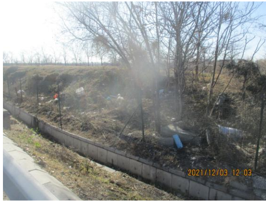
(三)昌平区 京新高速出京方向 15.6 公里处护网外有废弃物。