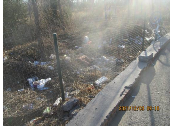
(二)丰台区 五环路外环方向 64 公里处护网外有废弃物。