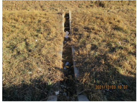
京新高速出京方向<箭亭桥-太平庄收费站>（海淀段：10.6公里处护坡有废弃物 T10:31）