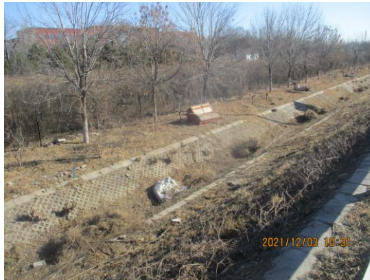
京新高速进京方向<太平庄收费站-箭亭桥>（良好）