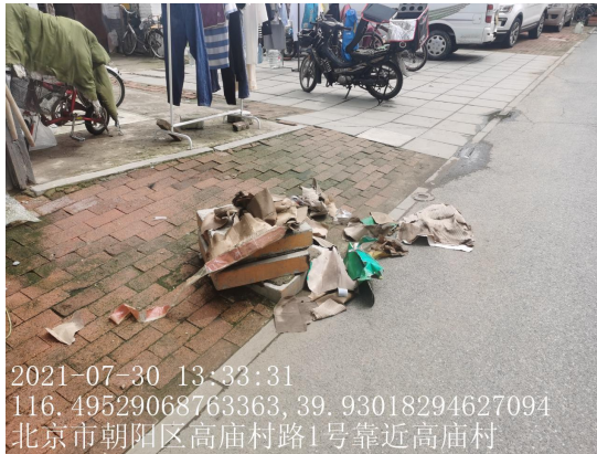
2021-07-30 13:33:31 116.49529068763363, 39.93018294627094 北京市朝阳区高庙村路1号靠近高庙村