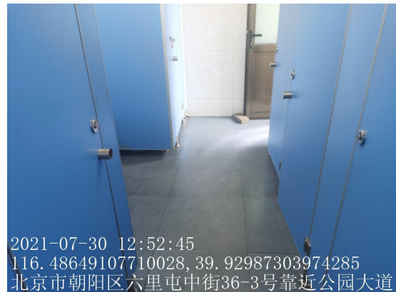
2021-07-30 12:52:45 116.48649107710028, 39.92987303974285 北京市朝阳区六里屯中街36-3号靠近公园大道