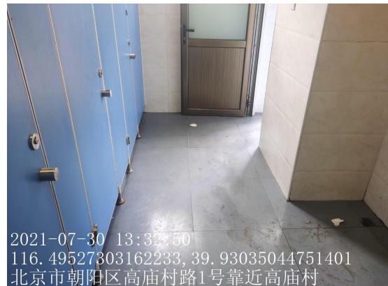
2021-07-30 13:32:50 116.49527303162233, 39.93035044751401 北京市朝阳区高庙村路1号靠近高庙村