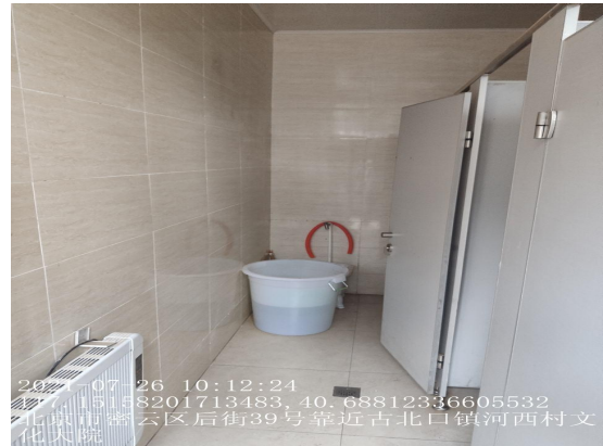
河西村甘桥南公厕（没有无障碍厕位、坡道/现场检查未见灭火器）T10:16