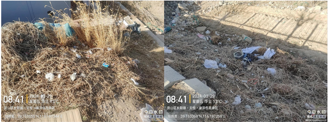
滨河路绿地(滨河路南口西侧绿地内有废弃物)T08:41