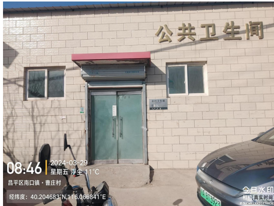
曹庄村北公厕(厕内地面不洁)T08:46