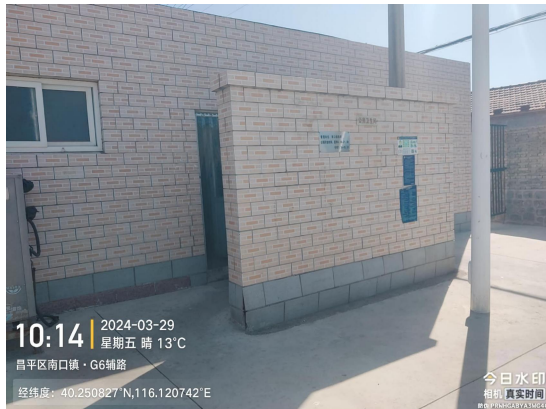
南口村村中公厕(厕内地面有明显污渍)T10:14