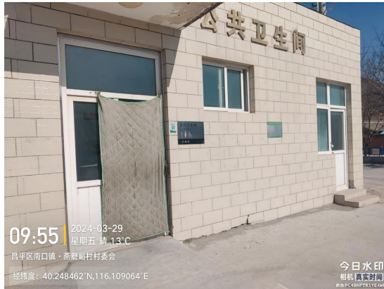
燕磨峪村公厕(小便池内有明显污渍)T09:55