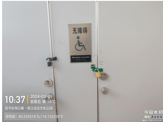
南口镇政府公厕(地面不洁)T10:37