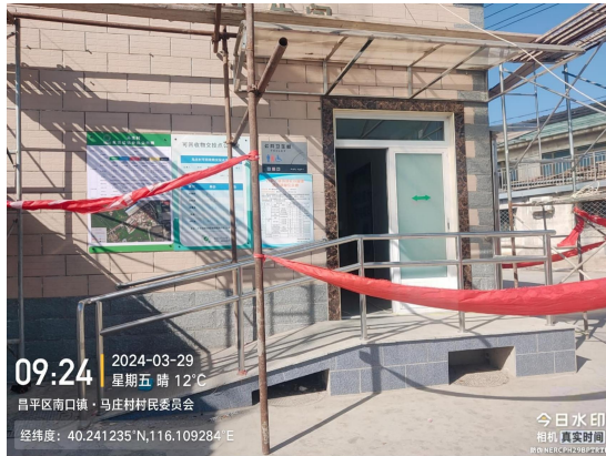
响潭村公厕(未安装标识牌)T09:34