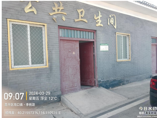
东李庄村公厕(纸篓满冒)T09:07