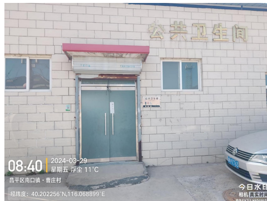
曹庄村北公厕(未安装标识牌)T08:46