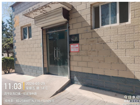
红泥沟村北公厕(洗手台不洁)T11:03