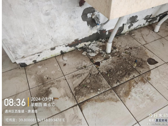
石上村公厕 060628A(小便池内有明显污渍)T08:36