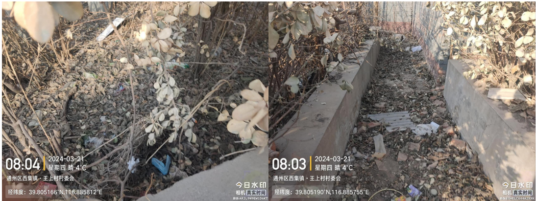
岳上村委会门前路(村委会门前路面有废弃物、垃圾收集站周围有大件垃圾)T08:14