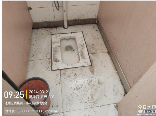
肖家林村公厕 060612B(厕内地面不洁)T10:07