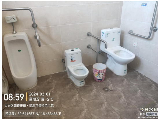
崔家庄二村十字路口东 50 米公厕(厕内地面瓷砖损坏)T09:48