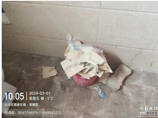
伊庄村青魏路南侧地旁边公厕(坐便器有明显污渍)T10:05