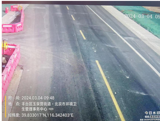
平翔路(路面有渣土遗撒)T09:52