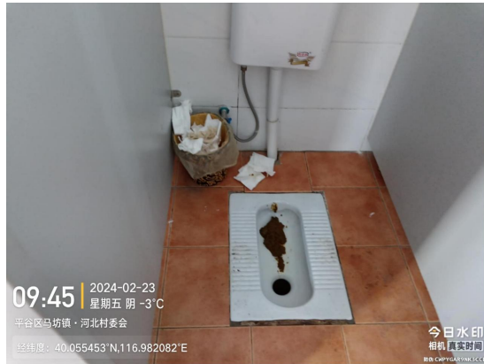
河北农贸市场公厕(大便器内有积存物)T09:45