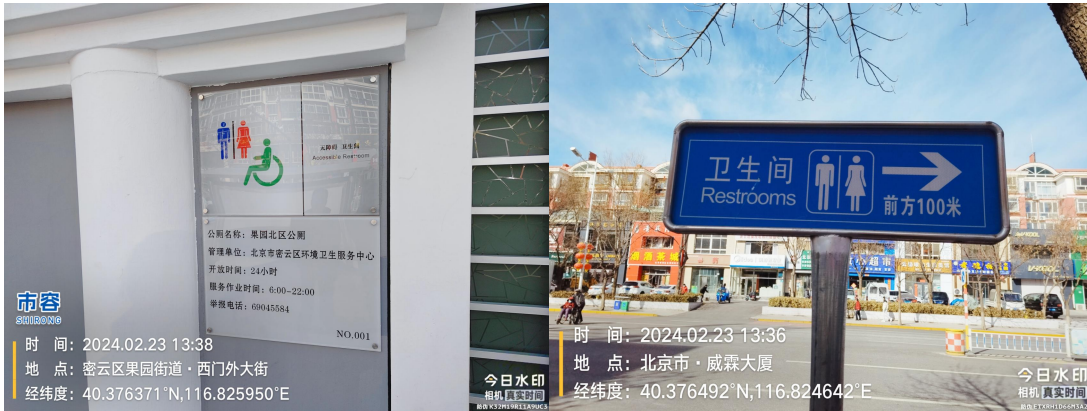
果园北区公厕(蹲台不洁)T13:38