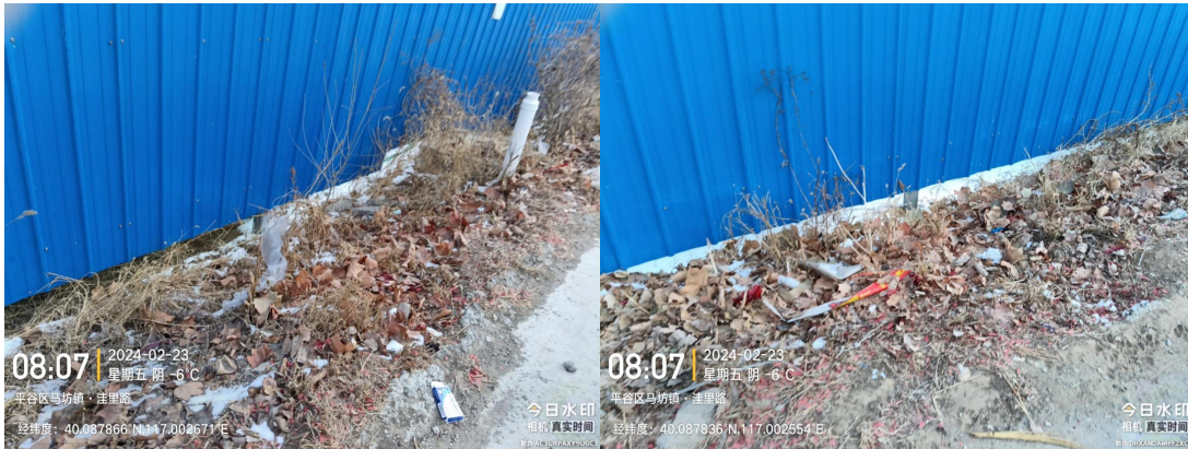
河奎村中心路(河奎北街 5 号西侧 20 米东侧路面有废弃物) T08:39