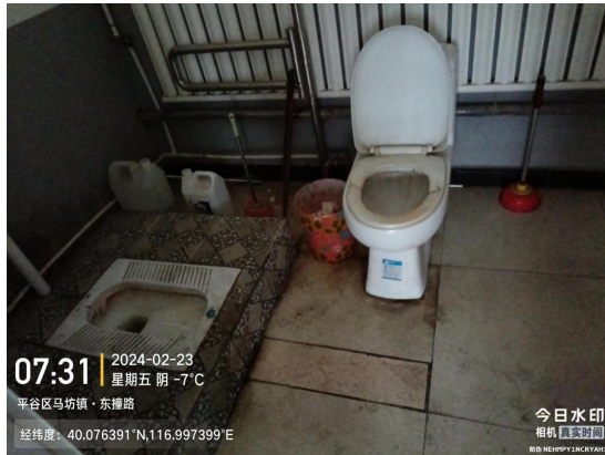
东撞村村委会院内公厕(坐便器有明显污渍)T07:31