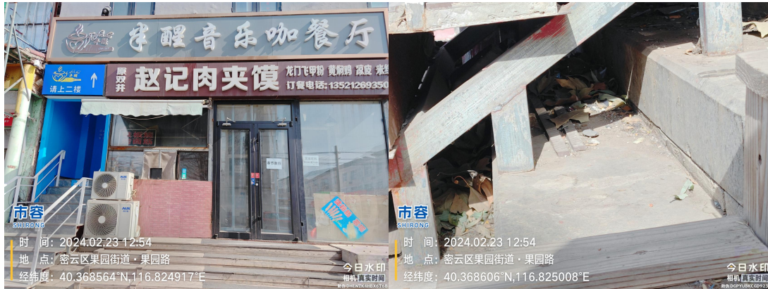
果园路东侧佰面稻手擀面门前(良好)T12:56