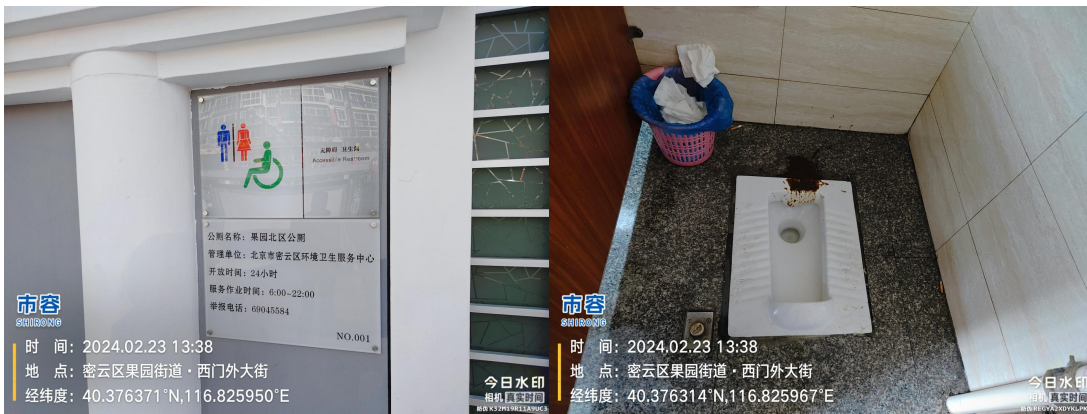
果园北区公厕(纸篓满溢)T13:38