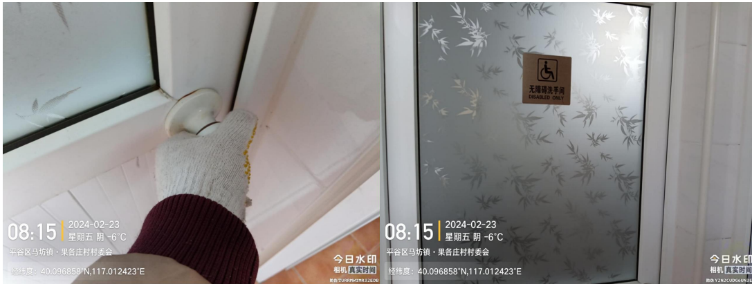
果各庄公园公厕(无障碍卫生间未正常开放)T08:20