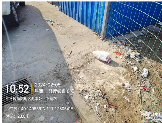
东晓东中转站(责任区内有建筑垃圾堆放)T11:01