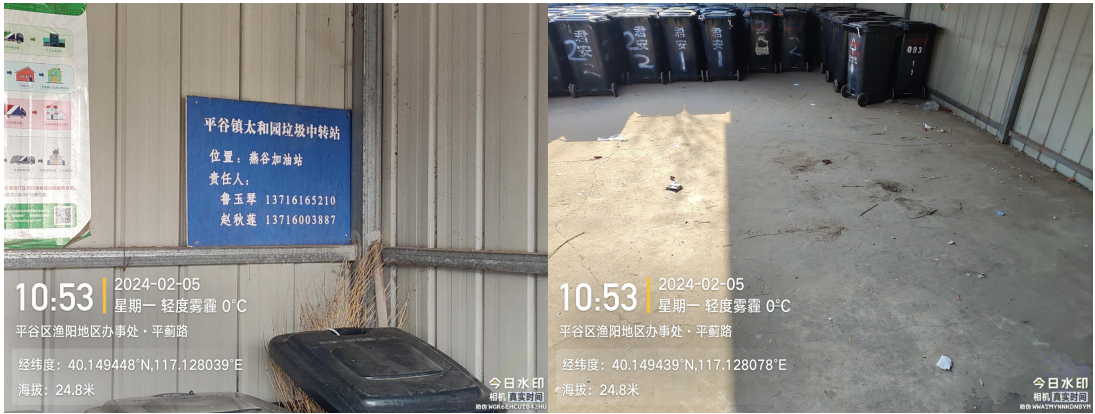
平谷镇太和园垃圾中转站(责任区内有废弃物)T10:53