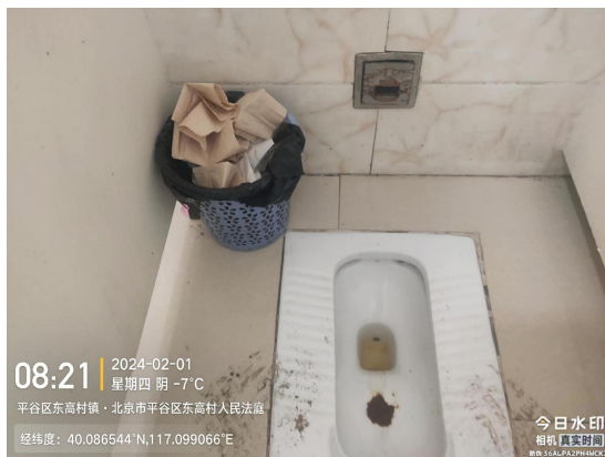
东高村法庭南公厕(地面不洁)T08:21