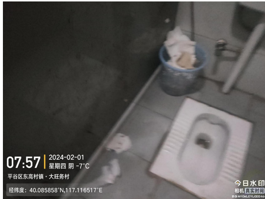
大庄户村委会公厕(纸篓满冒)T08:13