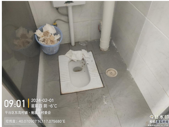
南庄户村北公厕(大便器内有积存物)T09:55