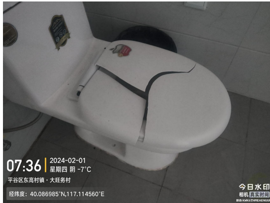
大旺务市场公厕(无障碍卫生间未正常开放)T07:56