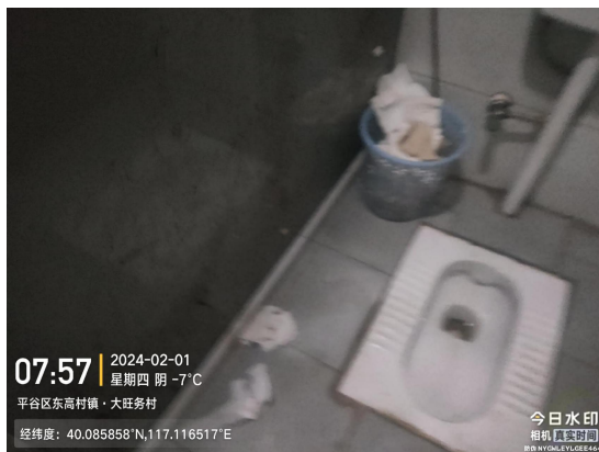
大旺务市场公厕(地面有废弃物)T07:56