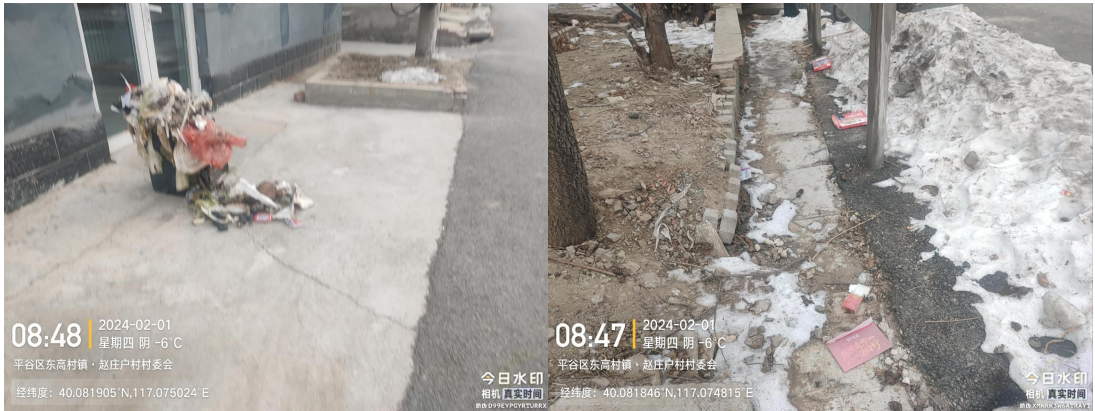
曹家庄村村委会门前路(村委会西侧 150 米处堆物堆料) T09:23