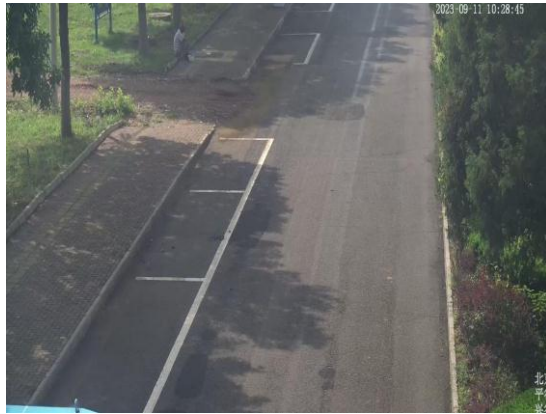
平谷南街路（机械化作业未达到质量标准）T10:32