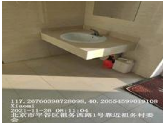
金海湖镇滑子村公厕（公厕内未配置灭火器）T9:13