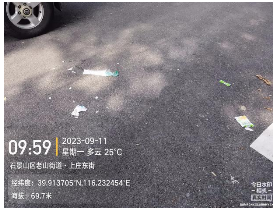
老山东小街（路边花池内有废弃物）T10:07